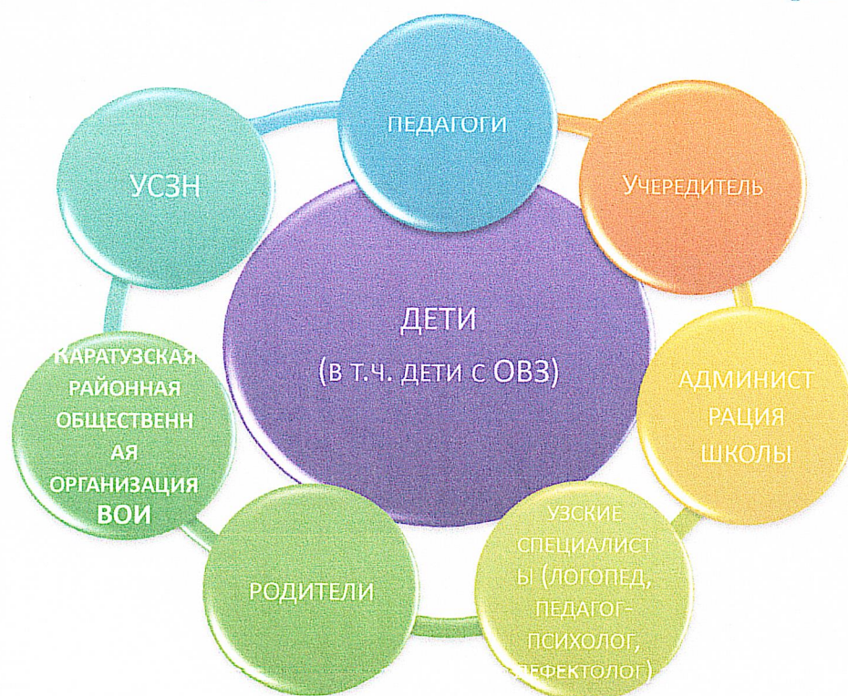
Рис. 1. Структурно-функциональная модель обустройства инклюзивного образования

Выявленные особенности инклюзивной практики послужили основанием для разработки следующей структурно-функциональной модели инклюзивного образования Школы (рис 1.)